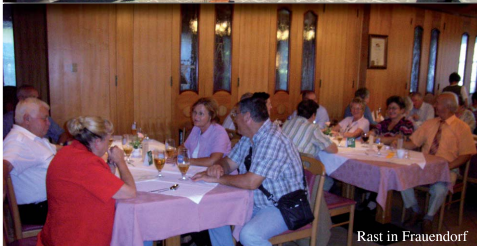
Rast in Frauendorf