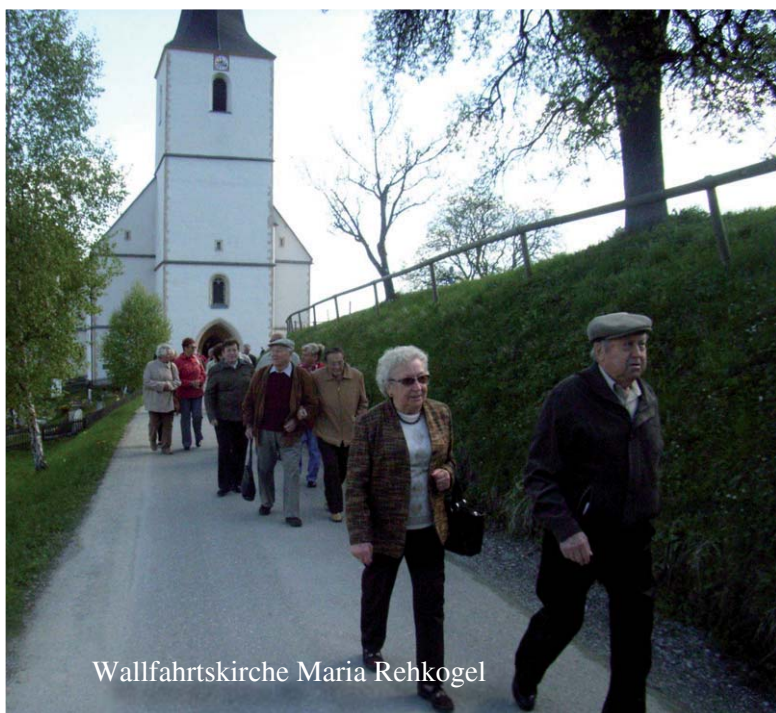
Wallfahrtskirche Maria Rehkogel