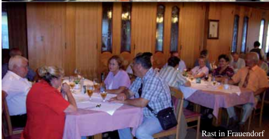
Rast in Frauendorf