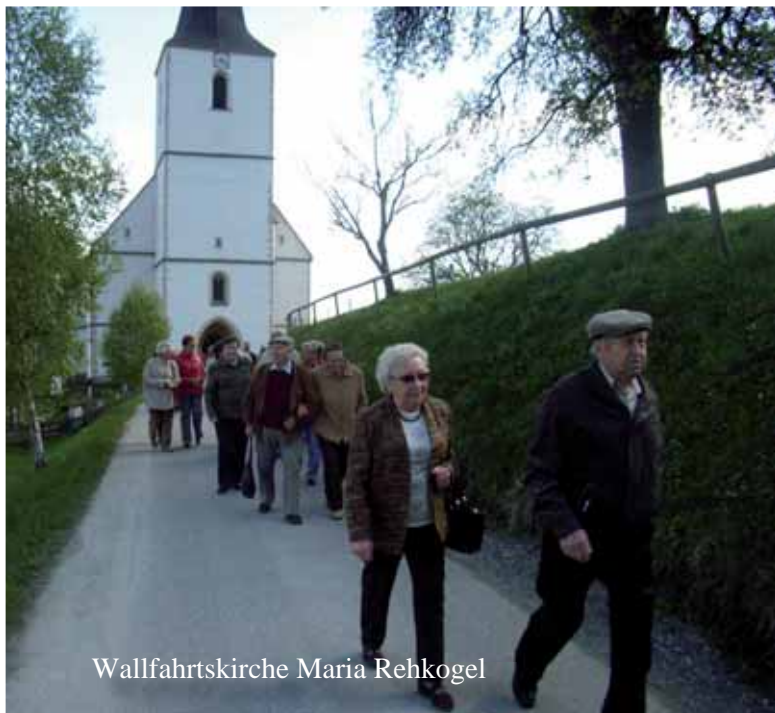
Wallfahrtskirche Maria Rehkogel