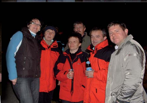
Danke an alle Helfer und Besucher.